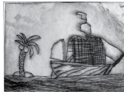
Schülerarbeiten der Kolumbus-GS, Klasse 5

Hochdrucke (Materialdruck, Linoldruck) als auch Tiefdrucke