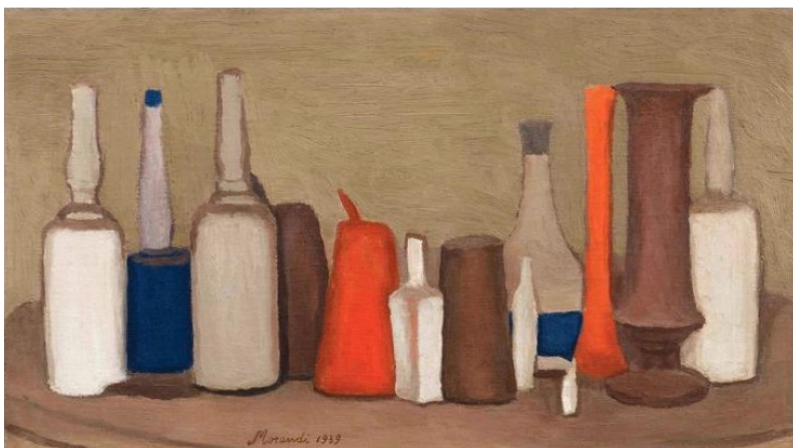
Giorgio Morandi, Natura morta (still Life), 1939, oil on canvas

So zeichnest du jede Flasche ganz einfach!