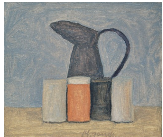
Giorgio Morandi, Natura morta (Still Life), 1962, oil on canvas.

Wenn du tolle Bilder gemalt hast, stelle sie doch einfach auf auf Instagram „atriumjugendkunstschule“.