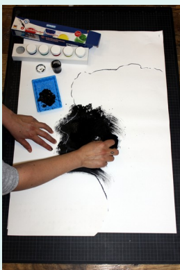
6// mit schwarzer Farbe und Schwamm an der Kontur vorsicht entlang tupfen