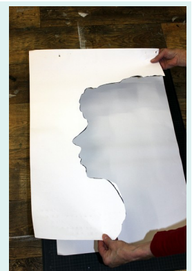
5// Schablone auf ein sauberes neues Blatt legen