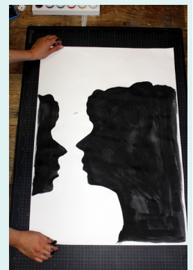
10/ Was kannst du noch damit anstellen?