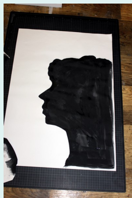
8// getrocknete Schablone umdrehen