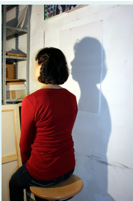
1// Arbeitsplatz einrichten

Du benötigst: Stift, Papier, schwarze Wasser-/Acryl- oder Plakafarbe, Schwamm/ Lappen, Cutter/ Schere