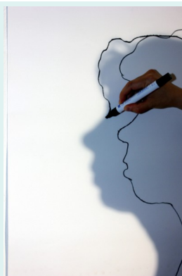
2// saubere Umrisslinie finden