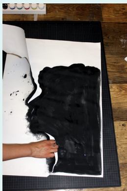
7// Fläche füllen