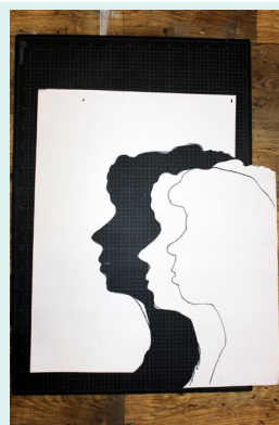
4// Ausschnitt entfernen