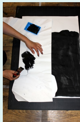
9// Vorgang wiederholen