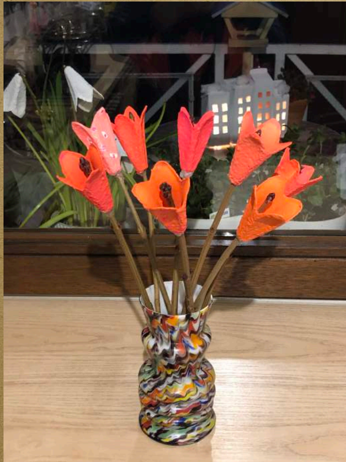
Ein bunter Blumenstrauß aus Eierkarton gebastelt

Das brauchst du dafür: Eierkarton, Schere, Farbe, Pinsel, Wasserglas, Zweige, Klebstoff